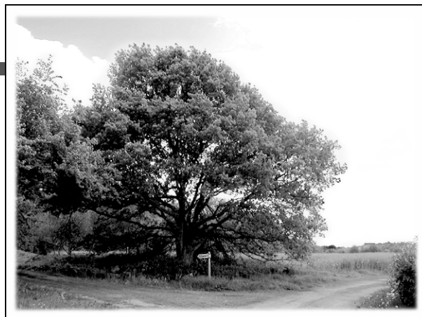
Le chêne de la Ville Auvé au carrefour des chemins.